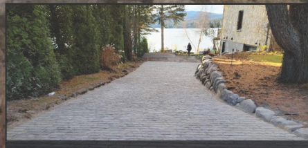
Aménagement paysager complet