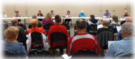
Une très belle participation à l'AGA de juin dernier.

Le 13 juin dernier, l'organisme des Amis de Marie de Saint-Côme a tenu son assemblée générale annuelle (AGA) au Centre