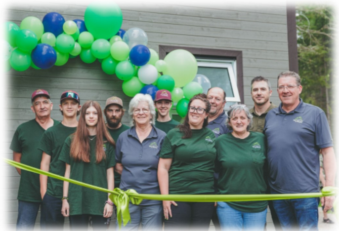
Les employés de la SDPRM