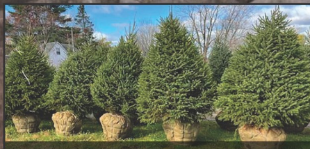
Plantation d'arbres et arbustes