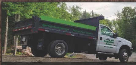
Livraison : terre, pierre et sable