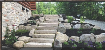
Excavation en espace restreint