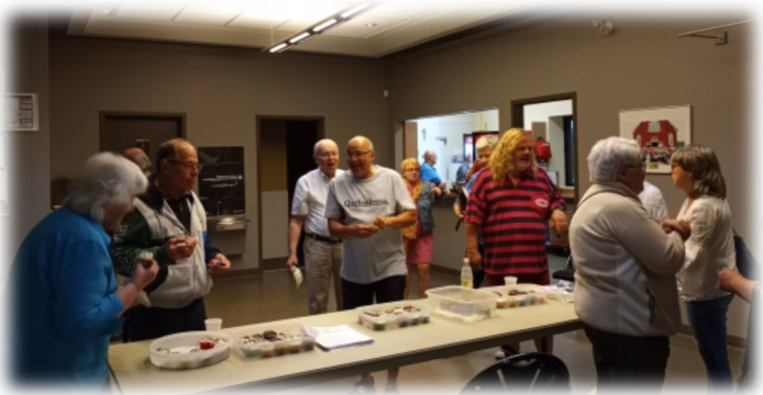
De petites gâteries pour de formidables bénévoles !