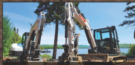
Location : mini-pelle excavatrice mini excavatrice sur roues