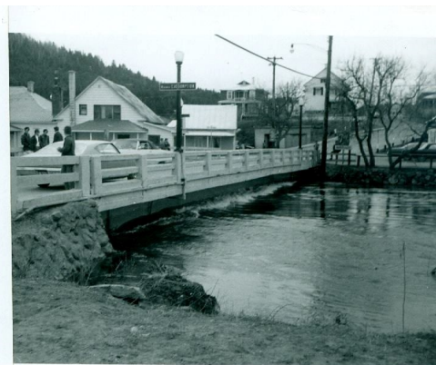
1970 Pont du Village

Il y a eu aussi celle de 1946 alors que le niveau élevé de la rivière a fait céder le barrage de la scierie à bois de Saint-Côme. Puis, celle de 1970 qui a mis en danger la solidité de l'ancien pont du village par les débris et arbres arrachés qui déferlaient sur la rivière et qui frappaient le pont.