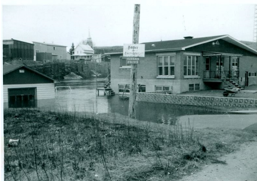
1970 Inondation à St-Côme

Voici un extrait du livre concernant une autre inondation : «En 1943, l'eau a envahi plusieurs chemins et ceux-ci sont devenus praticables seulement en chaloupes ou en canots. C'était à l'époque de la conscription et plusieurs, voulant y échapper, se sont servis de cette voie maritime de fortune pour aller se cacher.»